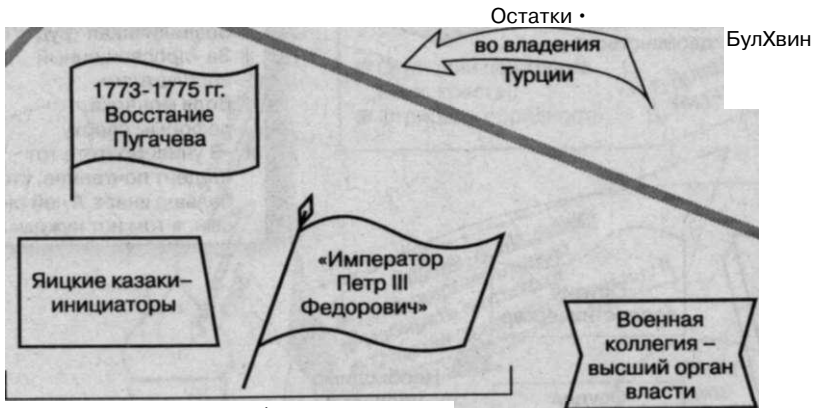
Пугачев, войско, выборные командиры